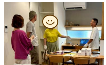
▲ 完成見学会の様子

毎月開催される弊社のイベント「家づくり勉強会」や「完成見学会」を通じて“HIKAGE”を多くの方々に知っていただくことができ、非常に嬉しく思います。 現在、打ち合わせを重ねているご家族様もおられ、HIKAGEの標準仕様や施工品質、土地探しなどについてもお話ししています。週末には多くの方々にお会いでき、私どももとても充実した時間を過ごしています。 また、先日は1年点検のためにお客様のご自宅にお伺いしました。太陽光を設置されているご自宅で、「太陽光を取り入れてから電気代が節約できています！」という嬉しい声をいただきました。 加えて、室内の快適さや災害時のことを考えても安心していられるなど、実際に住まわれてからの貴重なご意見もお聞きすることができました。 打ち合わせ中の方も、お引き渡し後の方も、ご不明点がございましたらお気軽にご相談ください。